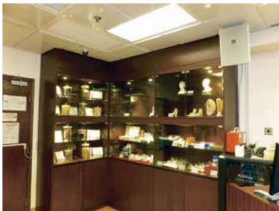
図6 東洋医学の展示スペース