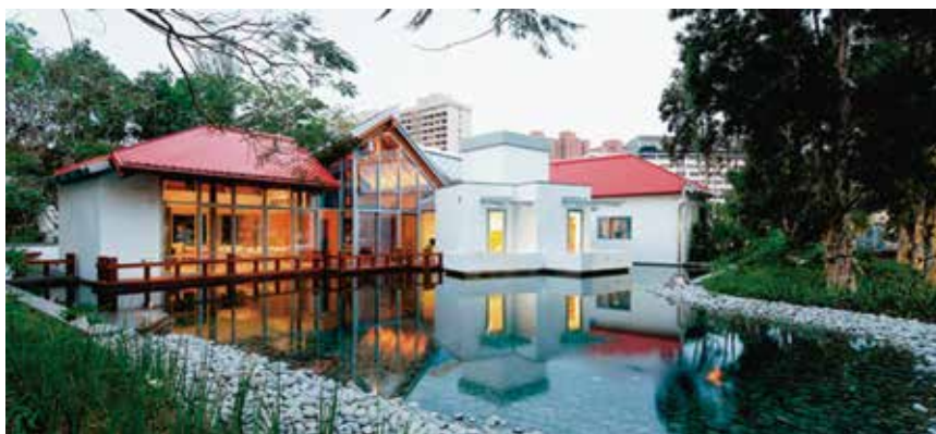
図3 Maggie's Cancer Caring Center の外観

故マギーが、『自分を取り戻せるための空間やサポートを』をコンセプトに、がん直面し、悩む患者やその家族、友人らのための空間を作り、がんの種類やステージ、治療方法に関係なく、いつでも利用し、専門的な支援が無料で受けられるセンターであった。また、心理的カウンセリングや栄養相談、運動指導が受けられ、生活面でのサポートも充実し