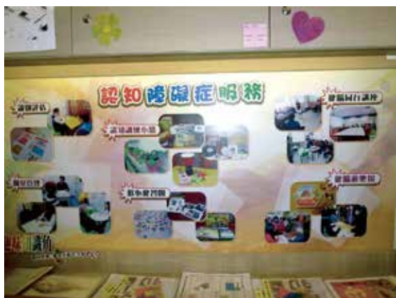
図2 コミュニティーセンターの認知症への取り組み

高層マンション（公営住宅）に囲まれた建物の1階にあるコミュニティーセンターを訪問した。日本でいうデイサービスと同様の役割を担っており、喫茶スペースでは利用者同士が、麻雀や伝統的なゲームを楽しみ、相談室や食堂、エクササイズを行う部屋も配置され、地域住民が交流を深める場として活用されていた。対象者は60歳以上の高齢者であり、年会費は、HK$30（約480円）で、月曜日から金曜日の8時半から17時半までの利用が可能な仕組みであった。食事は1回につき、HK$10（約160円）であり、食事の宅配サービスも行い、在宅で暮らす高齢者のニーズに答えるシステムになっていた。看護師やソーシャルワーカー、介護士が常駐しており、病気や生活について様々な相談に対応し、地域住民の健康保持、増進に努めていた。