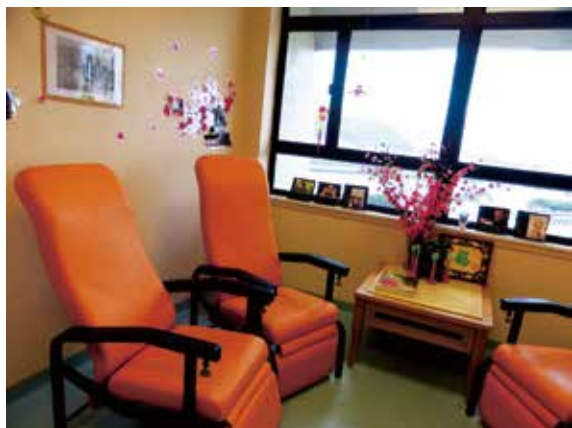
図4 Shatin Hospital の面会スペース