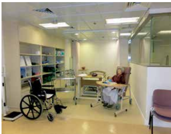
図5 香港理工大学 老年看護学演習室

実習室には、高齢者体験セットや模擬居住スペースが設置されていた。日本と同様に学生が演習を通して、高齢者に対する理解を深め、知識や技術の向上を促す工夫があった。学生が作成した高齢者の思い出を大切にしたアルバムや、昔の生活を回帰させる用具が展示され、老年看護に重点を置いた教育がなされていた。また、漢方や鍼灸等の東洋医学を部